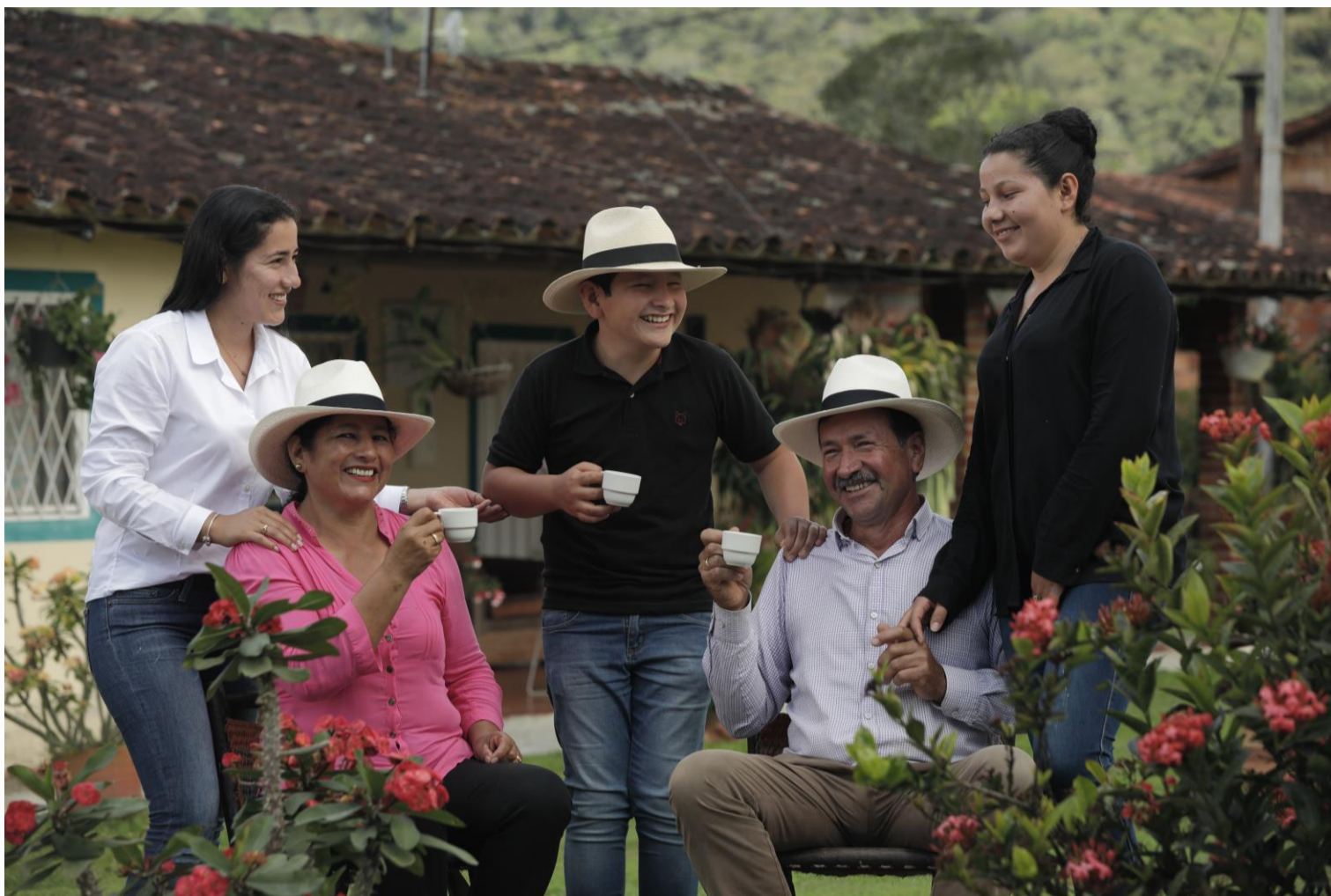
El gremio cafetero cierra este 2022 con varios récords en materia económica, social, ambiental y de gobernanza.

Al cierre del año cafetero (oct 2021-sep 2022), el valor de la cosecha alcanzó un récord de $14,5 billones, y se espera cierre el año civil en $14 billones, valor que se irriga en más de 600 municipios productores y consolida al sector como un motor clave de la economía.