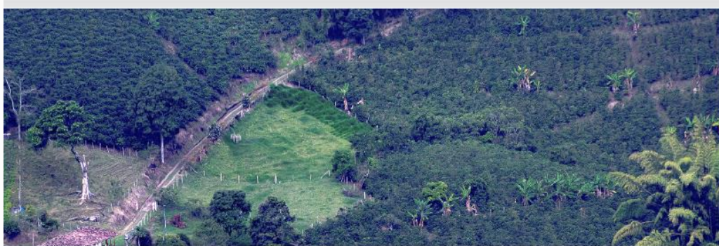
74° Seminario Científico Cenicafé