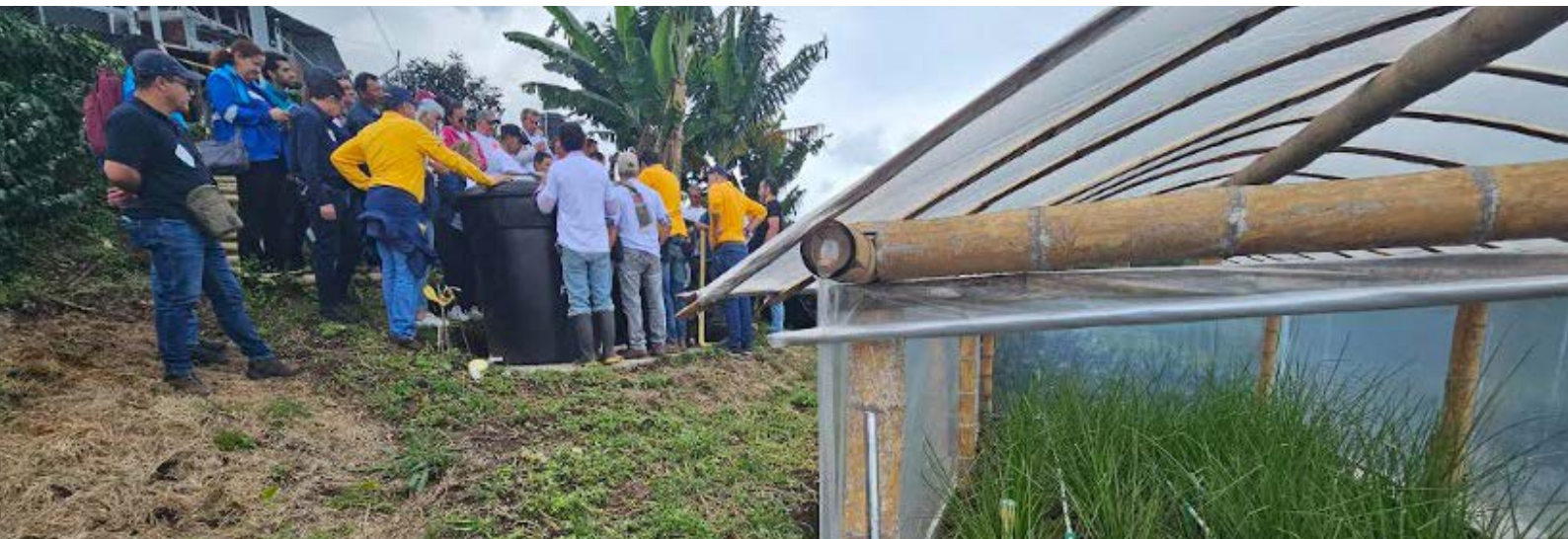
Día de campo - Entrega proyecto filtros verdes - Chinchiná, Caldas

Con una inversión de 375 millones de pesos gracias a la unión de esfuerzos entre Corpocaldas (250 M) y el Comité de Cafeteros con recursos del Fondo Nacional del Café (125 M) se realizó la instalación de 34 tanques tina y 34 sistemas primarios de tratamiento con filtro verde tipo invernadero en el municipio de Chinchiná, Caldas.