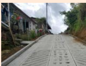
Construcción placa huella Neira - Caldas