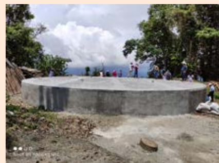
Abastos rurales - Tanque de abastecimiento Supía, Caldas