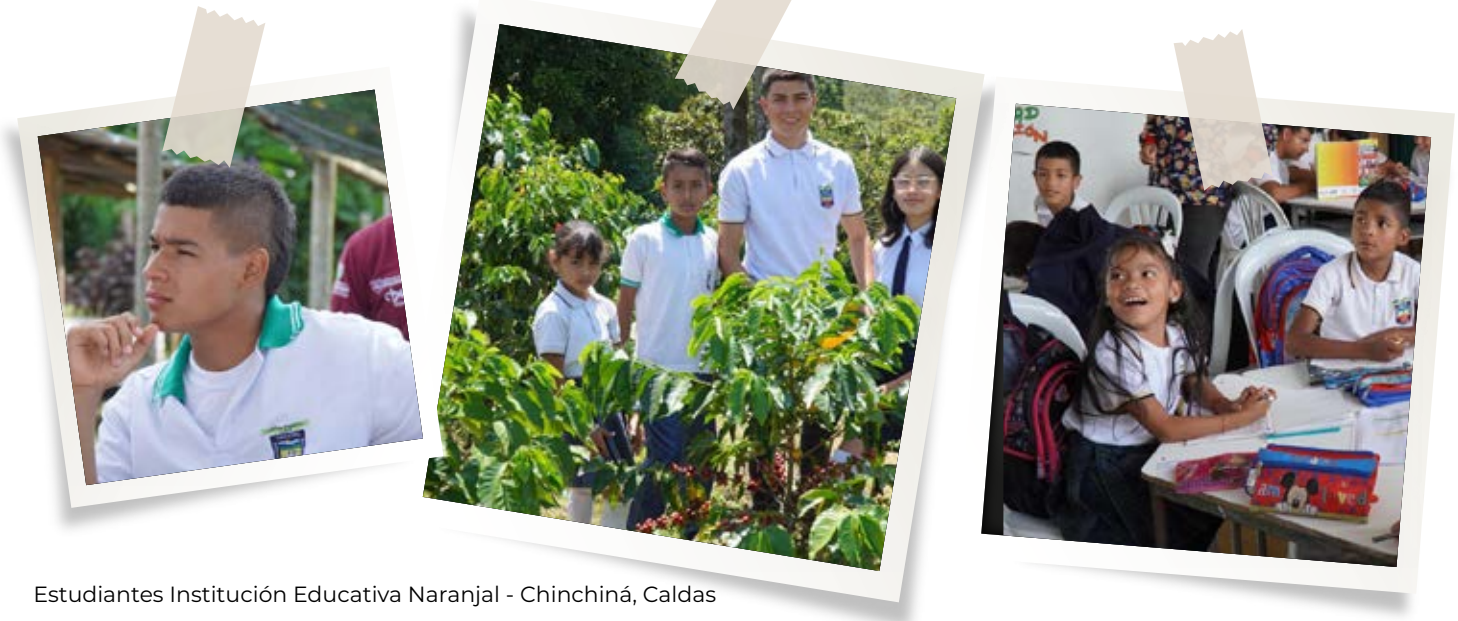
Estudiantes Institución Educativa Naranjal - Chinchiná, Caldas