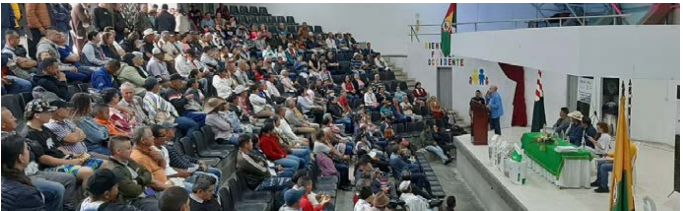
Entrega incentivos a la renovación y nueva siembra · Anserma, Caldas

Gracias a la unión de esfuerzos entre la Gobernación de Caldas, 23 alcaldías municipales y el Comité de Cafeteros de Caldas con recursos del Fondo Nacional del Café, se está ejecutando el convenio de renovación departamental con una inversión que permitirá incentivar 6.725.000 plantas de café (nuevas siembras, renovación por siembra y renovación por zoca), distribuido en los siguientes municipios: Anserma, Manzanares, Neira, Aguadas, Belalcázar, Filadelfia, Marmato, Chinchiná, Pácora, Pensilvania, San José, Aranzazu, Risaralda, Villamaria, Viterbo, Marulanda, Marquetalia, Salamina, Palestina, La Merced, Samaná, Supía y Victoria.