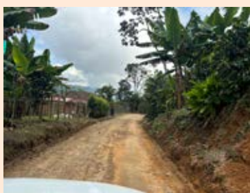
Mejoramiento y mantenimiento de vía Anserma - Caldas