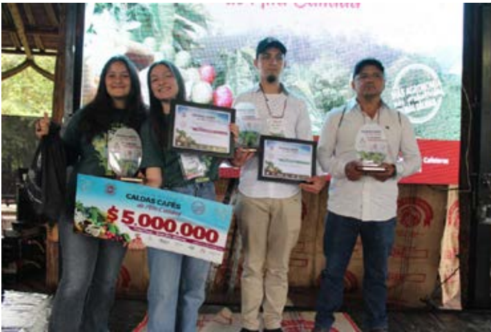
Premiación 20° Concurso, Caldas cafés de Alta Calidad · Manizales, Caldas

Durante la vigencia 2024 el Comité de Cafeteros de Caldas viene desarrollando los concursos de cafés especiales en varios municipios del departamento, con el fin de incentivar la producción de cafés de alta calidad. A través de estos se espera cerrar el año entregando incentivos a los ganadores por más de $295 millones.