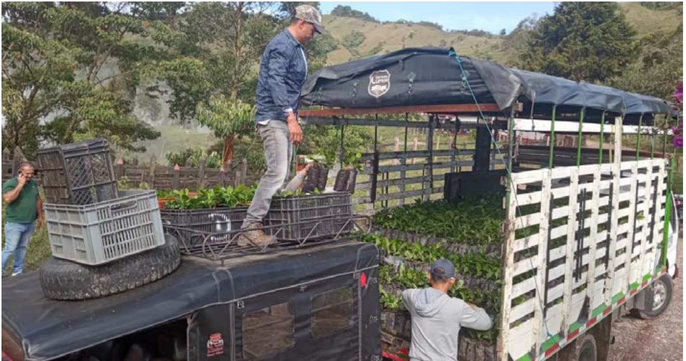
Entrega de colino de café, Fortalecimiento de la caficultura • Marmato, Caldas