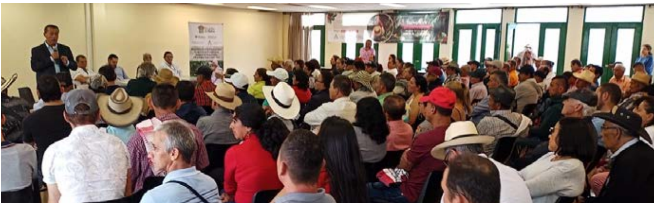
Entrega Incentivos a la renovación y nueva siembra · Neira, Caldas