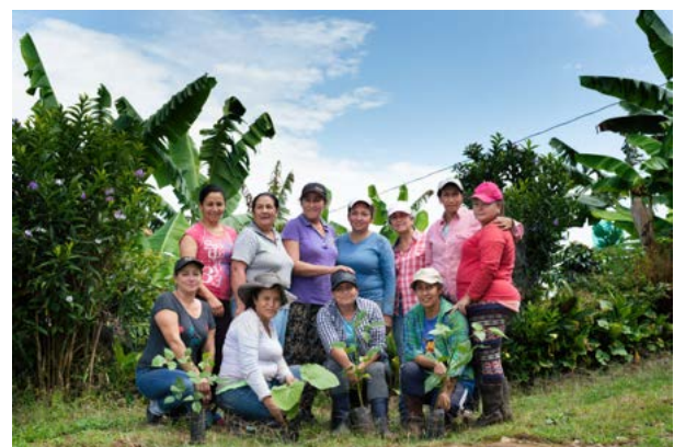
Siembra de árboles de especies nativas · Risaralda, Caldas